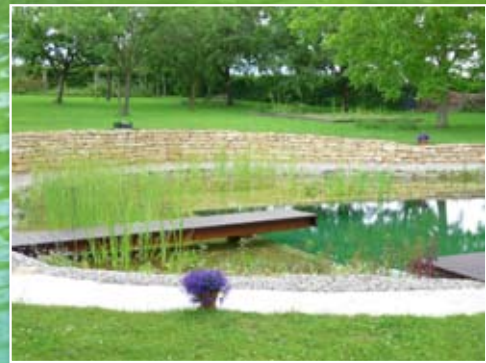
Baignade naturelle au Luxembourg