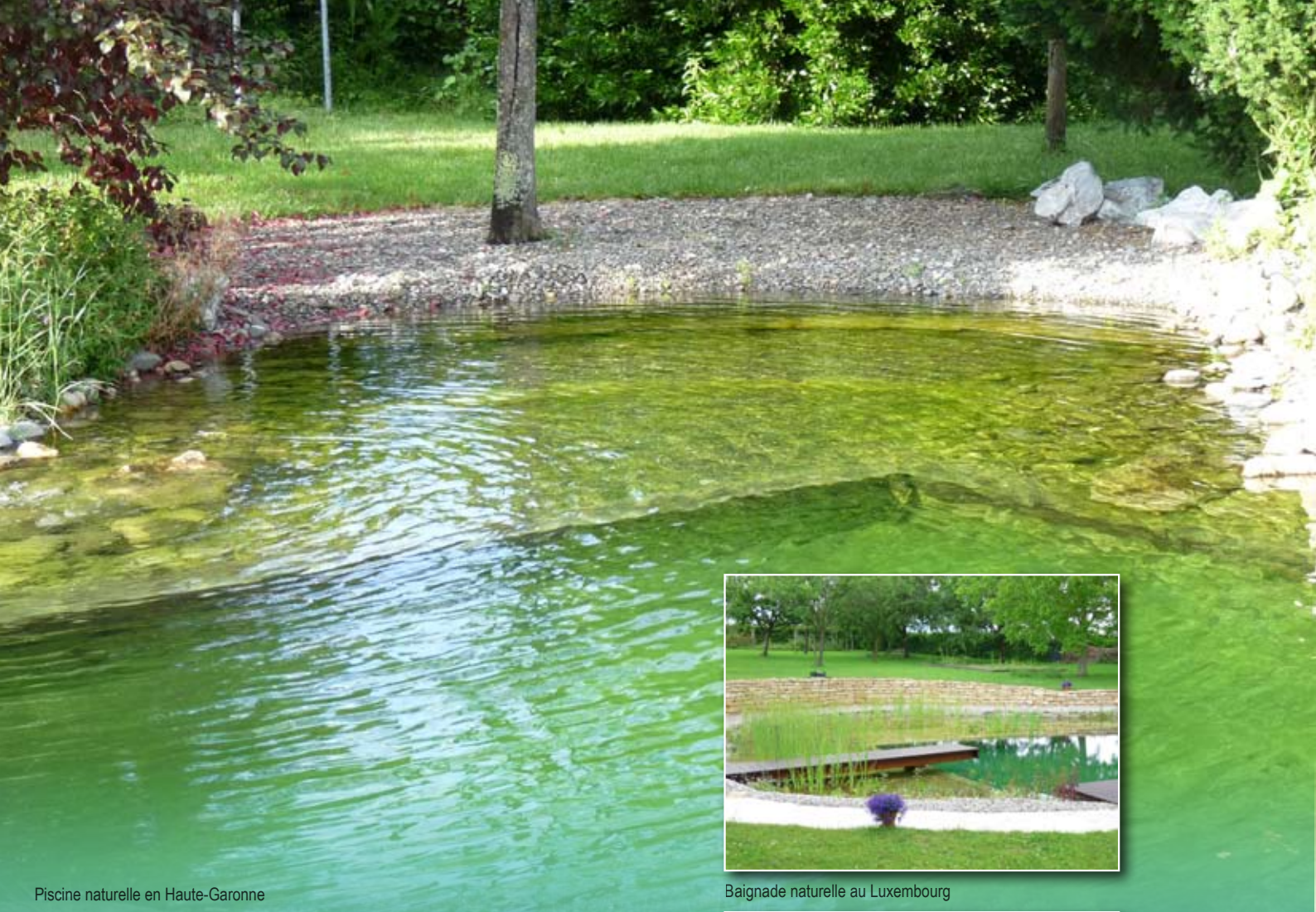
Piscine naturelle en Haute-Garonne