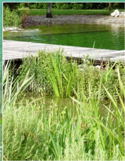
Baignade naturelle en Haute-Garonne