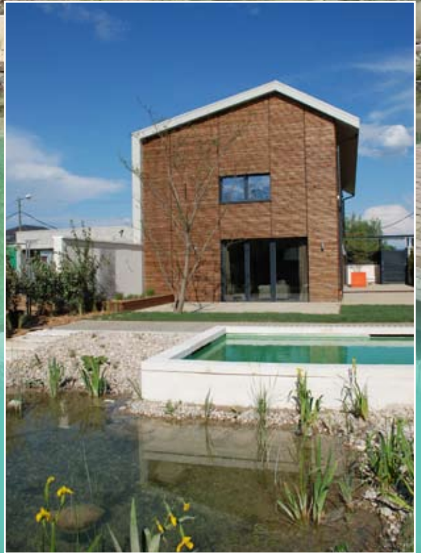
Piscine à St Priest