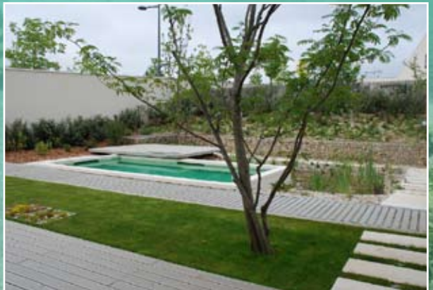
Piscine à St Priest